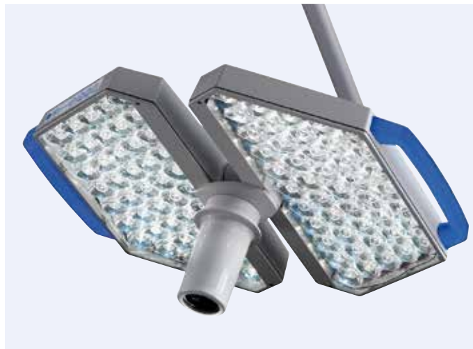
Integrierbar: das innovative Kamerasystem TruVidia® für Dokumentation, Lehre und Forschung

Die TruLight® 3000 OP-Leuchte ist kompatibel mit dem TruVidia® Kamera Portfolio und bietet dem Anwender alle Vorteile einer zuverlässigen Kameralösung. Die TruLight® 3000 OP-Leuchte ist darüber hinaus auch für einen flexibleren Einsatz entwickelt worden. So ist sie die optimale Ergänzung für Einsätze, u. a. in der Intensivstation zusammen mit dem breit gefächerten Trumpf Medical Portfolio. Die TruLight® 3000 OP-Leuchte findet vor allem in Notaufnahme, Schockraum, Intensivstation und im Kreißaal Anwendung. Auch ideal geeignet für Lehre, Forschung und interaktive Zusammenarbeit.