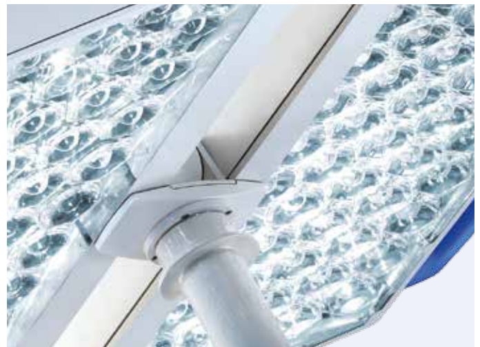
Die Multilinsen-Matrix ermöglicht die individuelle Anpassung des emittierten Lichts

Das optische Lichtsystem mit hoch entwickelter Multilinsen-Matrix sorgt für eine hervorragende Verteilung des emittierten Lichts und garantiert so eine homogene Lichtqualität in Fläche und Tiefe. Durch die flächige und lückenlose Anordnung der LED-Elemente sowie deren Ausrichtung innerhalb des Leuchtenkörpers ist eine Neueinstellung während der Operation nicht mehr notwendig.