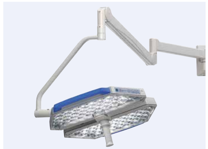
Der Spezialist: Die TruLight® 3000 OP-Leuchte als Wandausführung

Als effiziente OP-Leuchte schafft die TruLight® 3000 den Brückenschlag zwischen kompromissloser Lichtleistung und beeindruckender Wirtschaftlichkeit – und liefert damit gegenüber herkömmlichen Lichttechnologien wie Halogen und Gasentladung einen klaren Mehrwert. Durch die Energieeffizienz und Langlebigkeit der leistungsstarken LED-Technologie leistet die TruLight® 3000 OP-Leuchte zudem einen wertvollen Beitrag für die Umwelt.