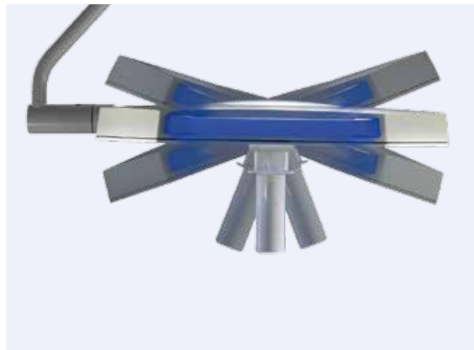
Einfache Positionierung durch leichten Leuchtenkörper

Wenn es schnell gehen muss, ist auf die TruLight® 3000 OP-Leuchte Verlass: Einfach in der Handhabung und leicht im Gewicht lässt sich die OP-Leuchte sehr einfach positionieren und an die jeweiligen Anforderungen der Operation anpassen. Als Decken-, Wand- oder Mobillösung fügt sich die TruLight® 3000 OP-Leuchte dabei flexibel in unterschiedlichste Raumanforderungen ein.